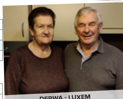
DERWA - LUXEM