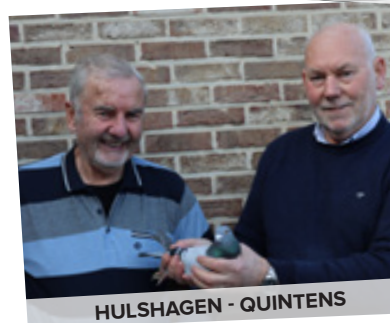
HULSHAGEN - QUINTENS