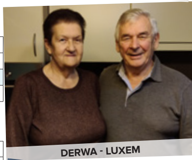
DERWA - LUXEM