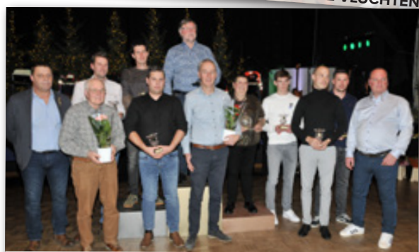
KHF JAARSE ALLE GEKLASSEERDEN