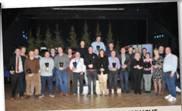
PROVINCIALE OVERWINNAARS 1 VLUCHT