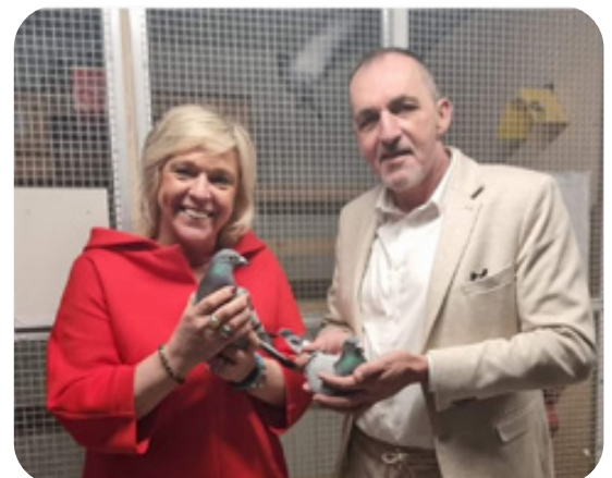
► Mevr. Hilde Vautmans, Europees Parlements lid