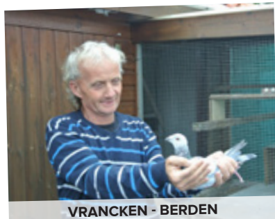
VRANCKEN - BERDEN