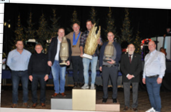
ALGEMENE KAMPIOENEN 2023