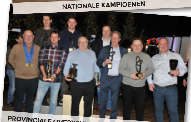
PROVINCIALE OVERWINNAARS MEERDERE VLUCHTEN