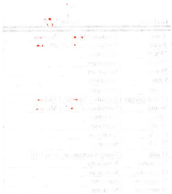
Figure 1. The relationship between the growth rate and the year. The growth rate is measured in percentage and the year is measured in years. The data points are shown with error bars representing the standard deviation of the growth rate for each year.